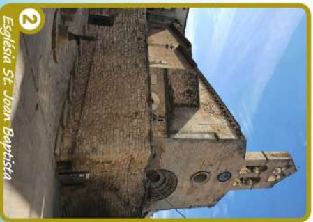
2 Església St. Joan Baptista