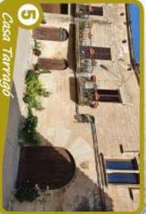
5 Casa Tarragó