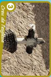
3 Creu de l'església