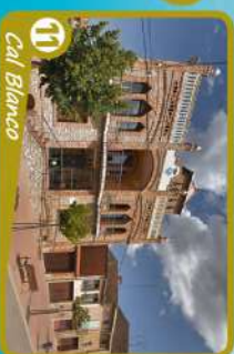
11 Cal Blanco