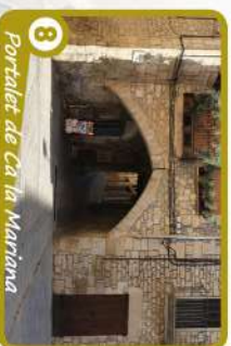
8 Portalet de Ca'ra Marriana