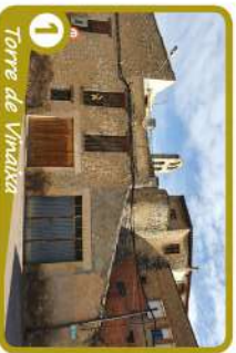
1 Torre de Vinaixa