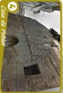
4 Casa de Pobler