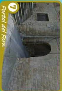
7 Portal del Forn