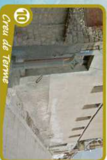
10 Creu de Terme