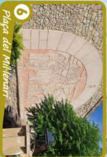
6 Plaça del Mil·lienari