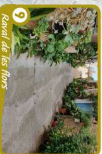
9 Ravall de les flors