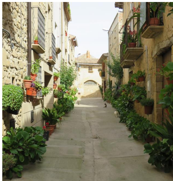
Raval de les flors.