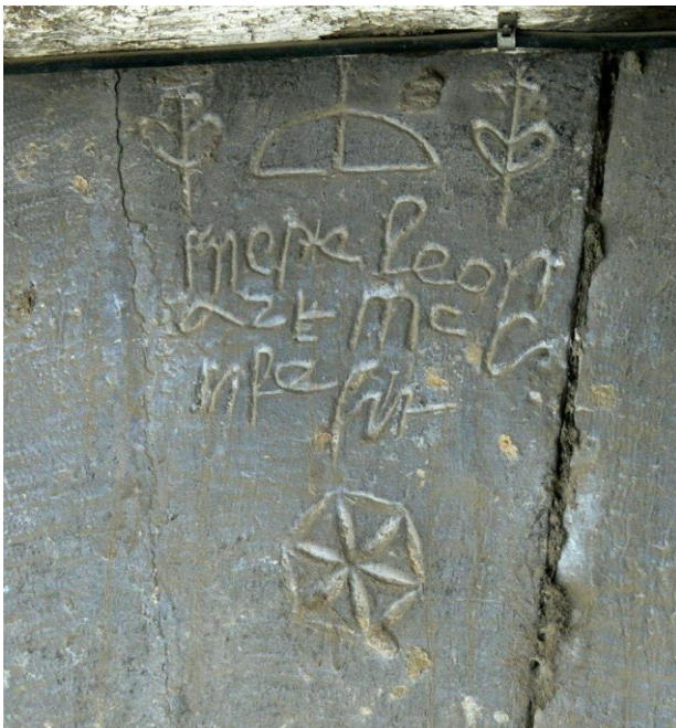
Dovella de la portalada de cal Moncarré, amb la inscripció: “mestre Leonard me confecit” (mestre Leonard em va fer), segle XVI.