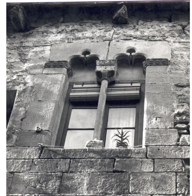
Finestra gòtica de la casa procura de Poblet. “Cal Panxa”