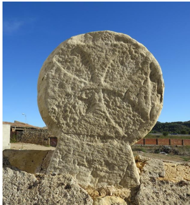
Estela discoïdal funerària del cementiri de Vinaixa.