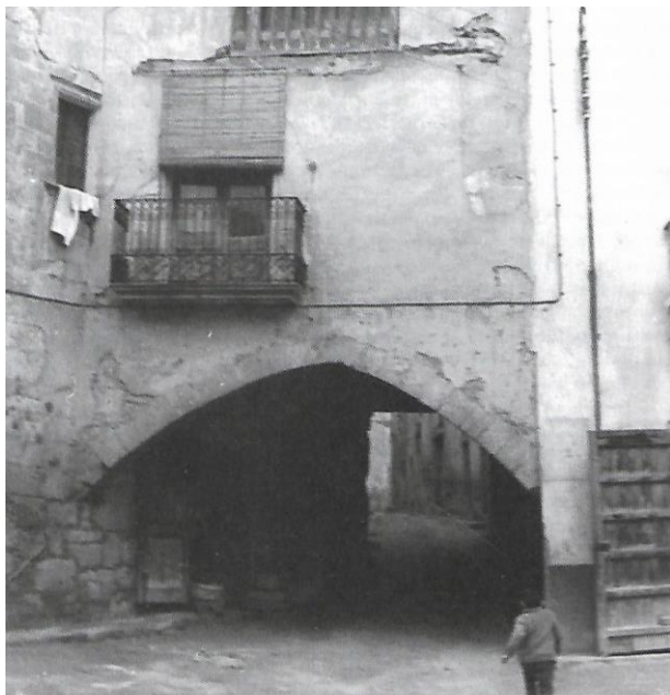
Arcada de cal Moncarré, una de les antigues portes d'entrada a la vila.