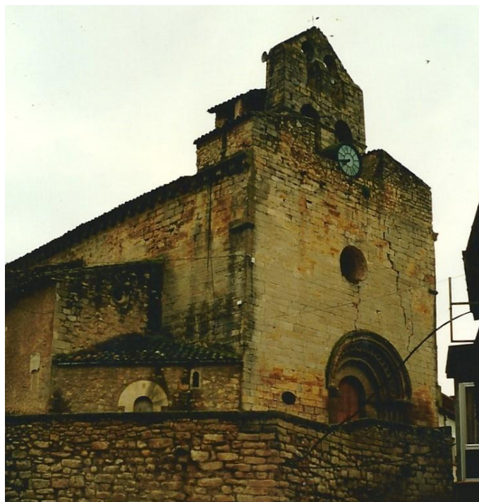
Vista general abans de la última restauració de 1995.

Romànica de transició, d'una sola nau central i capelles laterals. La portada romànica de l'escola de Lleida i capitells amb motius vegetals. Campanar d'espadanya amb quatre campanes, dues de les quals van ser instal·lades l'any 2012 i donades per particulars. Una va ser batejada amb el nom de MAGINA i l'altra amb el nom de MONTSERRAT.