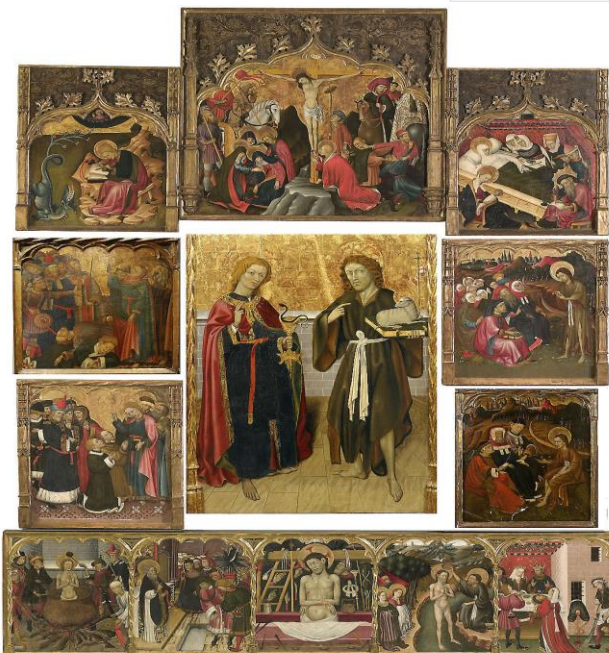
Retable dels sants Joans (1440-1445) de Bernat Martorell. Fotomuntatge amb les taules de tots els museus.